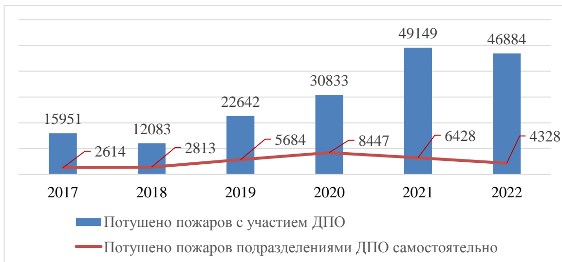
Рисунок 1. Участие подразделений ДПО в тушении пожаров на территории Российской Федерации в 2017-2022 годах

Наибольшее количество случаев привлечения подразделений ДПО к тушению пожаров в 2022 году зафиксировано на территории Новосибирской области (5 768), Московской области (3 409), Ростовской области (2 686), Алтайского края (2 151), Республики Башкортостан (1 788) и Краснодарского края (1 773).